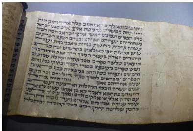
'Saragossa Scroll,' Jewish Museum, Istanbul

+ישעיהו ט"ו+ למרבה המשרה ולשלום אין קץ וגו' אמר רבי תנחום, דרש בר קפרא בציפורי: מפני מה כל מ"ם שבאמצע תיבה פתוח, וזה סתום? ביקש הקדוש ברוך הוא לעשות חזקיהו משיח, וסנחריב גוג ומגוג. אמרה מדת הדין לפני הקדוש ברוך הוא: רבוננו של עולם! ומה דוד מלך ישראל שאמר כמה שירות ותשבחות לפניך - לא עשיתו משיח, חזקיהו שעשית לו כל הנסים הללו ולא אמר שירה לפניך - תעשהו משיח? לכך נסתתם.